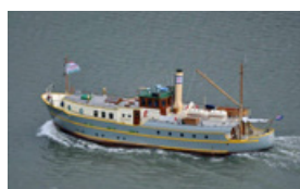
S/S «George Stephenson»